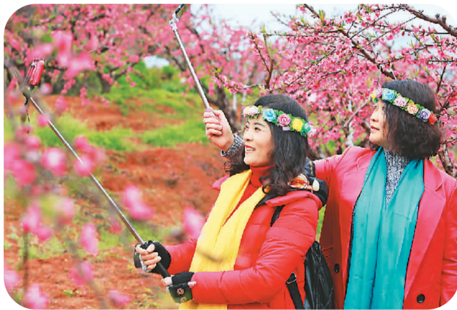
游客在江西省赣州市龙南县桃花源园自拍。

中国旅游研究院黄璜博士说：“在中国，女性劳动参与率比较高，她们要面对来自工作和家务两方面的压力。她们的休闲时间往往比男性更少，压力也更大。旅游和休闲活动能够让她们得到更好的休息和恢复。”“三八”妇女节快到了，希望社会更加重视女性休息、休假和旅游的权利，把她们休息、休假和旅游的权利作为女性总体权利的重要组成部分来看待。”