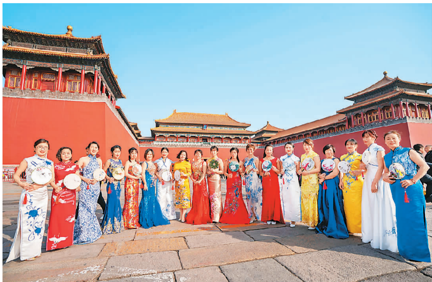
为迎接“三八”妇女节，在北京故宫午门，中建三局三公司北京分公司女职工游览拍照。

在北京劝业场的背后，青砖灰瓦间，是星巴克在北京的一家多重体验式旗舰店。一到三层的独栋空间分别对应咖啡、茶与酒，这里就像一个被放大的客厅空间。我落座一楼，看到铜制的棚顶倒映在大理石台面上，大厅一角有一幅用咖啡豆手工黏贴成的壁挂，颜色或深或浅的咖啡豆构成了宛如太和殿屋顶和朵祥云，香气四散。窗外，是著名的老北京老字号——谦祥益。它依然保存着老店的风貌。古色古香的谦祥益承