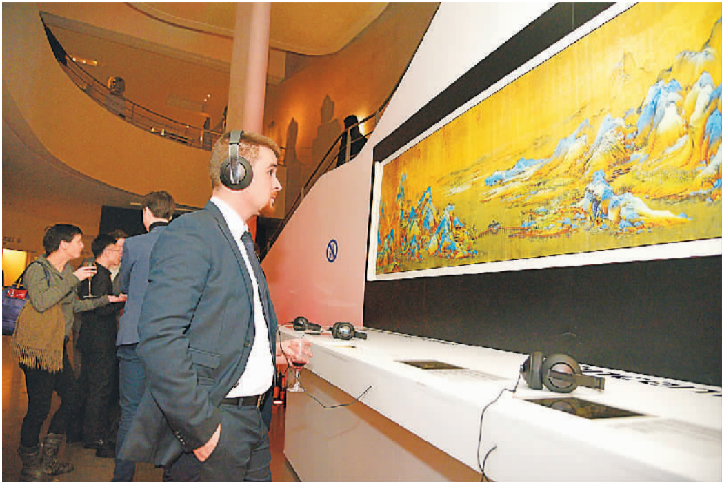
▲法国观众欣赏以《千里江山图》为灵感创作的音乐作品

“跨越重洋万里，跨越世上千年，流散世界的中国文物，这个农历新年与你我团聚。”今年春节前夕，不少中国网友发现只要打开小程序“博物官”，主页会弹出一个抢眼而漂亮的专题，即“国宝全球数字博物馆”（下图）。点击进去，能够欣赏到珍藏在法国吉美国立亚洲艺术博物馆的25件中国文物，其中包括镇馆之宝元霁蓝釉白龙纹梅瓶、有五千年多历史的玉猪龙、目前世上最大动物型尊——象尊、辽代等身三彩罗汉像、西汉白玉虎等珍贵文物。