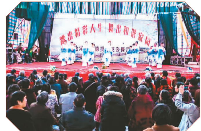
▶ 图为村民在表演广场舞

表演的《开门红》广场舞拉开活动帷幕。随后是三房族表演的广场舞《舞动中国》、三房族表演的《最炫民族风》。接下来我们六房族表演广场舞《好日子》。由于服饰漂亮,旋律优美,加上妻子和堂嫂、堂嫂、侄儿媳妇们精彩的动作,乡亲们看了频频鼓掌。