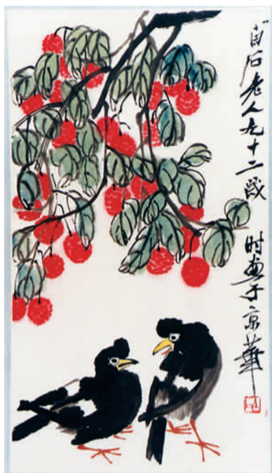
“大师窖藏——齐白石特展”上展出的齐白石作品《八哥》

值得一提的是，馆内拥有国内一流的展陈照明效果，仿自然光的照明既满足了美术作品对灯光的挑剔，也保证了观众看展时的舒适性。2014年春节前夕，第十二届全国美术展览获奖作品在山东美术馆展览，作为国内规格最高的美术大展，离京巡展首站选择山东美术馆，这是为何？展览部主任王吉水道出其中奥秘，“一楼主展厅2000平方米，长230多米，层高8米，是全国最大的主展厅，可以根据作品的尺寸随时调节高度和角度。这在全国为数不多。”在展览中，有一幅高达8米的巨作，当时也仅有山东美术馆能承接。在这个展厅，灯光能抬高到7米位，也可下降到1米位，从8米巨作到名片大小的画作，让观众