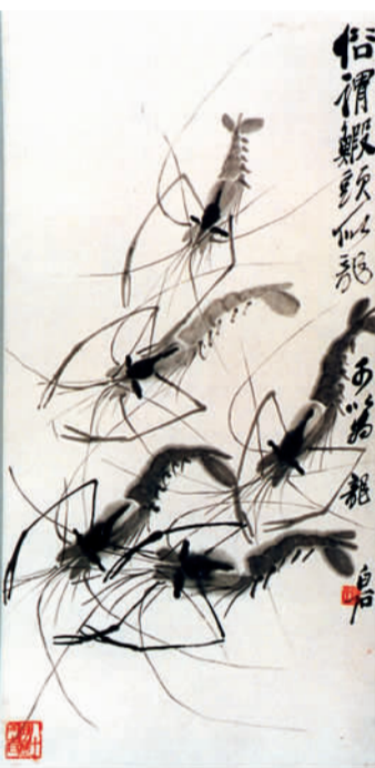
“大师窖藏——齐白石特展”上展出的齐白石作品《虾》