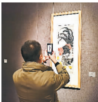
观众拍摄齐白石画作