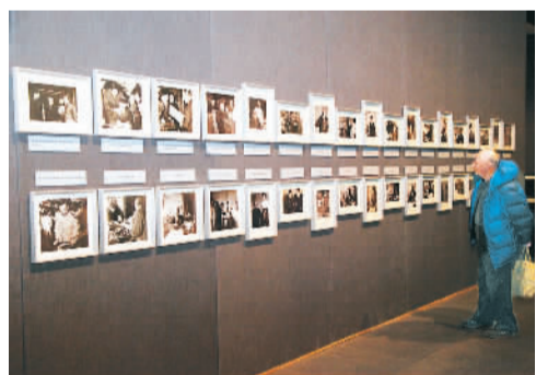
在“大师窖藏——齐白石特展”现场，观众观看齐白石生活影像