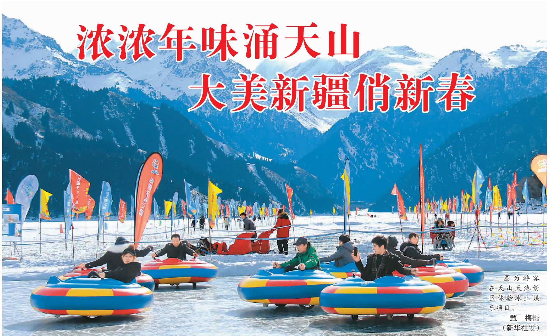
图为游客在天山天池景区体验冰上娱乐项目。

韩正表示,《生物多样性公约》第十五次缔约方大会将于2020年在中国举办。要积极做好筹备工作,全面履行东道国义务,确保举办一届圆满成功、具有里程碑意义的缔约方大会。