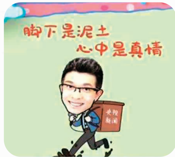
央视新闻“表情包”记者小朱贺新春动画截图

最古老的也可能最时尚，最传统的也可能最现代。或许正是因为这样，现代派艺术的主要代表、西班牙画家毕加索在他的创作中融入了古埃及绘画的独特表现手法，成就了《亚威农少女》等名作。