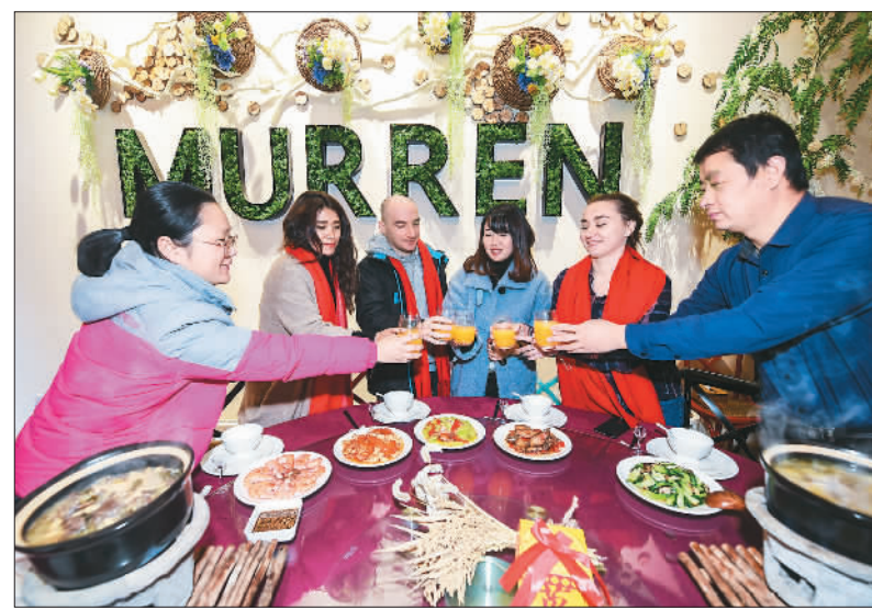
1月22日,位于浙江省杭州市临安区的乡村民宿——“慕仁民宿”迎来了一批来自俄罗斯、玻利维亚、塞尔维亚等国的留学生,他们跟着当地百姓学习写春联、包汤圆、打麻糍,在热闹喜庆的气氛中感受中国年,迎接即将到来的新春佳节。图为留学生在乡村民宿聚餐。