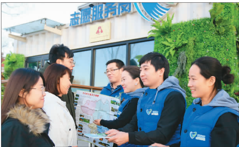
1月22日,北京市延庆区团委组织志愿者在服务岗开展咨询服务。

为应对高峰车流,世园会园区周边设置了10处停车场,容纳2.2万个停车位,涵盖地面公交、旅游大巴和小汽车等停放需求。世园会园区外围高速公路周边设置驻车换乘停车场3处,通过摆渡车将游客运送至园区,减缓停车压力。会期将通过智能诱导与智慧调度,平衡车流、人流,保障交通运行顺畅有序。