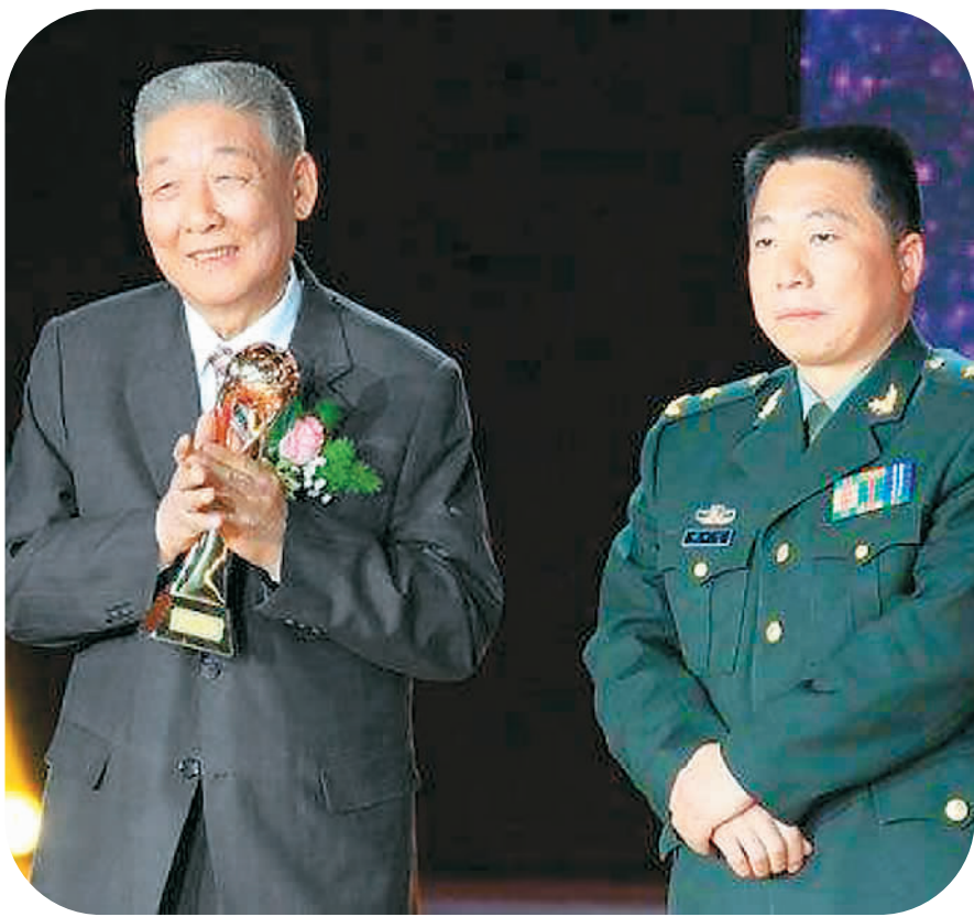
2011年1月18日,孙家栋在“CCTV中国经济年度人物”评选中获终身成就奖。图为孙家栋(左)与航天员杨利伟在颁奖仪式上。

虽然那时候新中国成立已经50多年了,但是从科学技术发展来讲,这还是较短的时间,而我们在一无二白的基础上,在这么短的时间内,成功实施了嫦娥一号探测月球任务。作为该任务的主要参与者,其背后的艰辛我体会很深,高兴、兴奋、激动,可谓百感交集。我深为我们国家有这么大的成就而自豪。