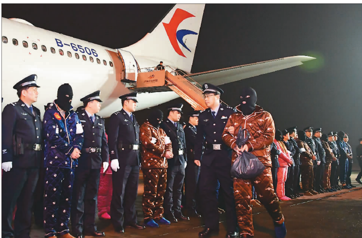
1月11日，随着两架中国民航包机降落在河南省郑州市新郑国际机场，191名利用网络刷单实施诈骗的犯罪嫌疑人被公安机关从老挝押解回国，涉及国内多个省区市的800余起案件成功告破，涉案金额6000余万元。图为犯罪嫌疑人被押解回国。