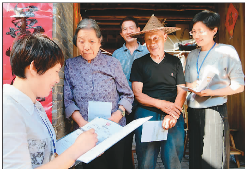
2018年5月8日，福建省宁德市古田县纪检监察干部向流下村村民了解惠农专项资金的使用情况。

“以党的政治建设为统领全面推进党的建设，取得全面从严治党更大战略性成果，巩固发展反腐败斗争压倒性胜利，一体推进不敢腐、不能腐、不想腐，健全党和国家监督体系，确保党的十九大精神和党中央重大决策部署坚决贯彻落实到位，以优异成绩庆祝中华人民共和国成立70周年。”在中国共产党第十九届中央纪律检查委员会第三次全体会议上，中共中央总书记、国家主席、中央军委主席习近平发表重要讲话强调。 反腐败斗争从形成“压倒性态势”到取得“压倒性胜利”，离不开党的建设制度改革。十八届三中全会审议通过的决定指出，紧紧围绕提高科学执政、民主执政、依法执政水平深化党的建设制度改革，加强民主集中制建设，完善党的领导体制和执政方式，保持党的先进性和纯洁性，为改革开放和社会主义现代化建设提供坚强政治保证。 5年来，通过破藩篱、去顽疾、立规矩、建制度、正风气，党的建设制度改革协调推进，全面从严治党逐步实现制度化、规范化。