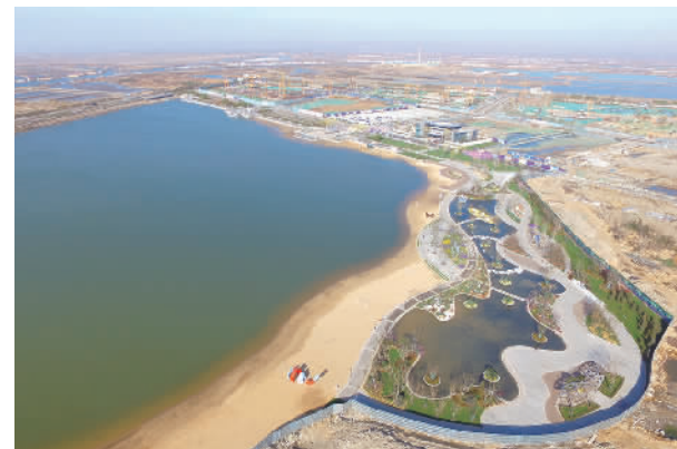
图为曹妃甸新城御海金沙沙滩浴场

海风吹拂了上千年,渤海之滨在新时代将彻底改变容颜。凭借京津冀协同发展的东风,乘上曹妃甸全域旅游的快车,曹妃甸新城以“乐海”为标签,打造立足京津冀、面向海内外的知名旅游目的地。“禀赋天成,生态怡然,凭海临风,曹妃甸新城将成为京津冀都市人的‘诗和远方’!”