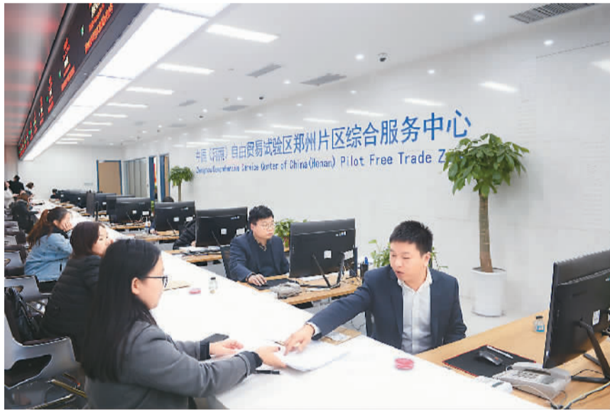
在中国（河南）自由贸易试验区郑州片区综合服务中心，工作人员在为企业办理相关业务（11月20日摄）。