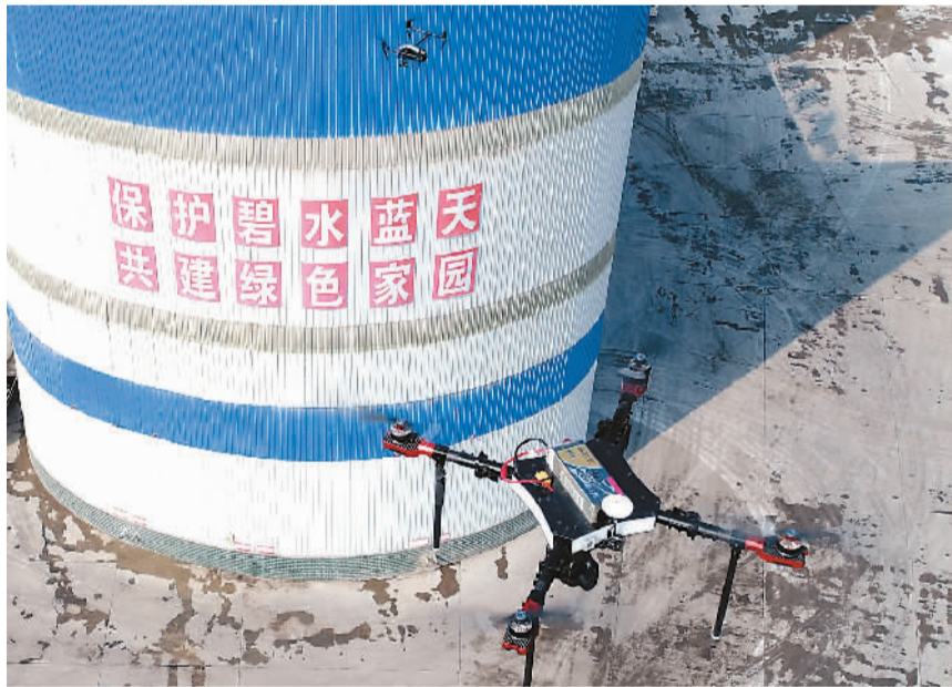
河北省邯郸市环保局魏县分局无人机在魏县一家企业监测空气质量指数（11月1日无人机拍摄）。