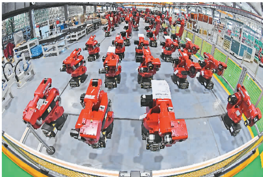
抢抓重要战略机遇期，坚定迈向高质量发展。图为沈阳新松机器人自动化股份有限公司工业机器人生产车间。

人民日报的一条微博被大量分享。文字很短，“转发！32条干货，带你速读中央经济工作会议。收藏，学习！”另配有9张图，清晰梳理了32句话。同是人民日报的一条谈楼市的微博，被近6万次转发，成为“中央经济工作会议”话题下的热门微博。这条微博摘录了中央经济工作会议精神说，要构建房地产市场健康发展长效机制，坚持房子是用来住的、不是用