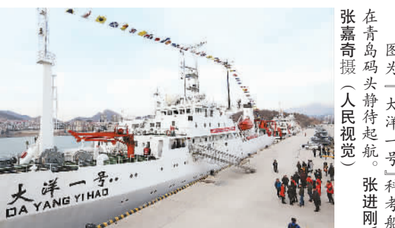
图为“大洋一号”科考船在青岛码头静待起航。

本报电 日前，位于青岛的自然资源部北海分局科考基地码头上人头攒动，大洋科考功勋船“大洋一号”科考船从青岛起航，将先后前往印度洋、大西洋执行中国大洋52航次科学考察任务。同时，该航次也是深海科考利器“潜龙三号”的首次大洋航次应用。 据中国大洋事务管理局负责人介绍，本航次任务经自然资源部批准，由中国大洋事务管理局组织，自然资源部第一海洋研究所、自然资源部第二海洋研究所、自然资源部北海分局联合实施，共有国内45家单位的311名科考队员（包括后备人员）参与，航程约23900海里，共计230天，预计2019年7月完成任务返回青岛。