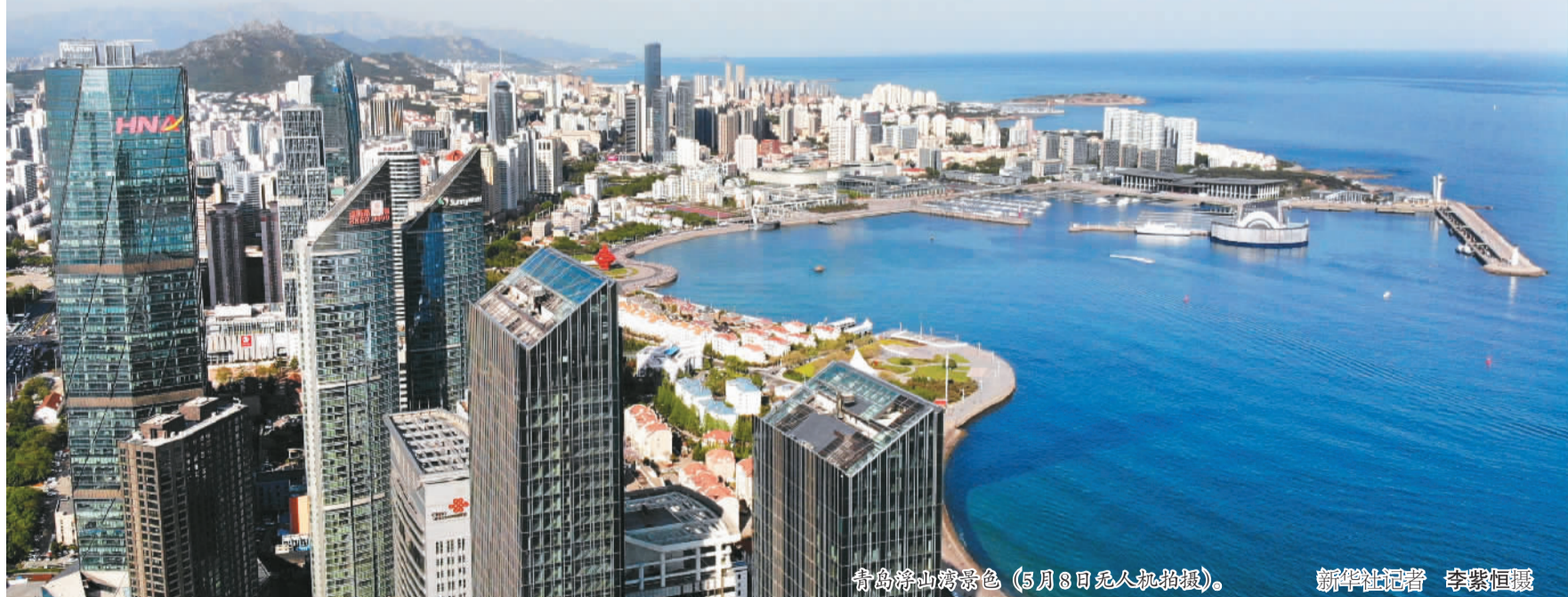
青岛浮山湾景色（5月8日无人机拍摄）。

四十不惑。改革开放40年，站在这个历史性的节点，眺望未来。青岛这座“以改革开放而兴”的城市，惟有抱持“改革开放再出发”的勇气和决心，惟有用一系列更大力度的改革开放举措，才能在新时代，创造出新的辉煌、书写新的篇章。