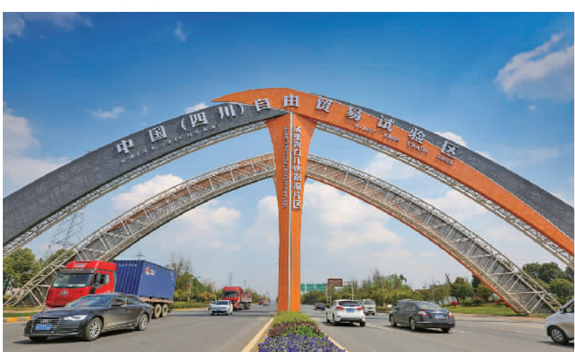
中国(四川)自由贸易试验区

不仅如此,青白江还出台“人才新政30条”“智汇青白江·产业英才计划”等一系列人才政策,设立全市首只2亿元的产业人才发展资金、全市首个专门的产业人才引进计划;启动“智汇青白江·蓉欧人才荟”人才专场活动面向全国揽才,全区人才总量以年均12%的速度增长,达8.6万余人。