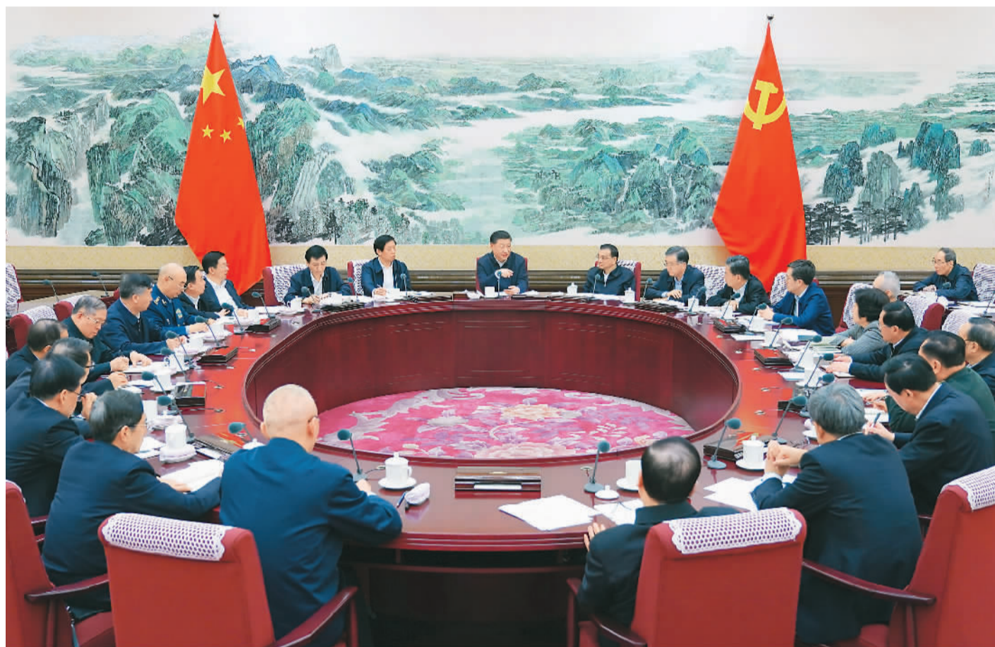
12月25日至26日,中共中央政治局召开民主生活会,中共中央总书记习近平主持会议并发表重要讲话。