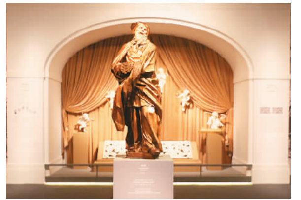
马蒂亚·施坦因尔的雕塑作品。