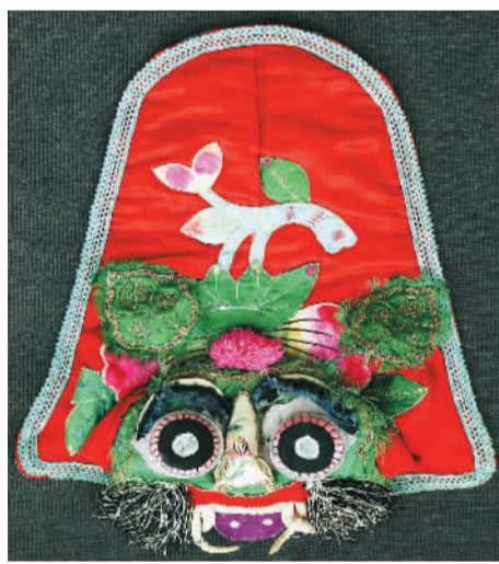
辽南特色绣品虎头帽

大连现代博物馆有不少藏品突出体现了辽南地域文化特色。2006年，作为辽南皮影戏代表的复州皮影戏被列入第一批国家级非物质文化遗产名录，2014年又被列入联合国急需保护的非物质文化遗产名录。辽南皮影作品是大连现代博物馆重点征集和收藏的对象。近年来，博物馆征集、收藏了数千件（套）皮影作品，上自清代，下至当代，形成了鲜明的馆藏特色。