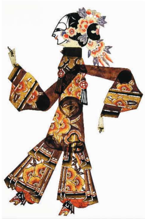
辽南皮影（盘髻旦头茬，花衣影身）