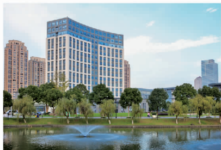
宁职院产教协同联盟大厦

宁职院借鉴德国“双元制”理念，建设中德智能制造国际学院，引进德国IHK（德国工商会）职业认证体系、核心课程、教学标准、管理办法和考核办法，培养中德双方适用的、具有国际化水准的新型技师型人才。