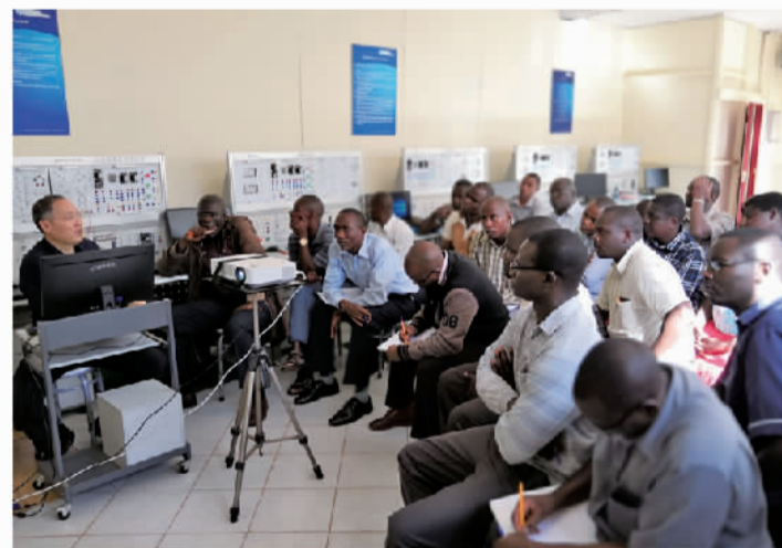
2017年宁职院外派教师赴肯尼亚援教

宁职院还借助这些平台吸引海外留学生，尤其是“一带一路”沿线国家留学生来校学习。目前，宁职院有100多名留学生来自“一带一路”建设参与国家。他们学成回国后，将成为熟悉中国文化并掌握至少一门专业技术的人才。