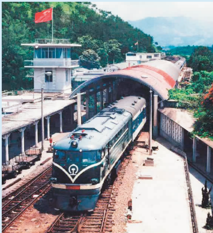
改革开放初期的罗湖桥。