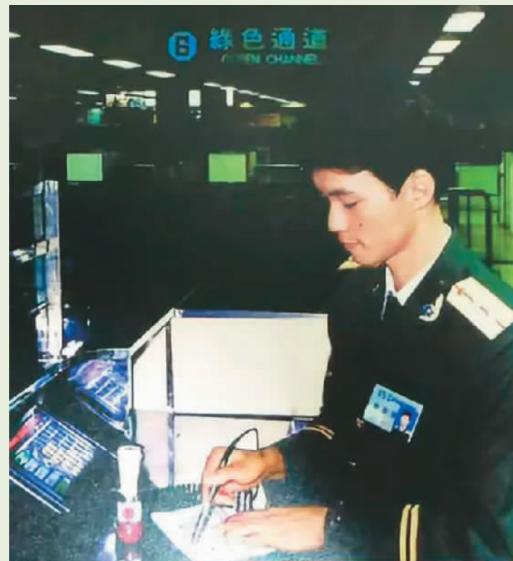
1988年，全国首套边防检查计算机验证系统在罗湖口岸启用。