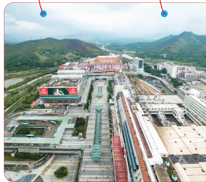
罗湖口岸联检大楼片区。