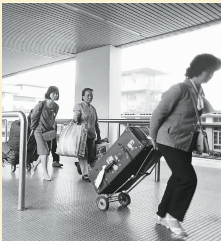
1988年6月拍摄的罗湖桥上的旅客。