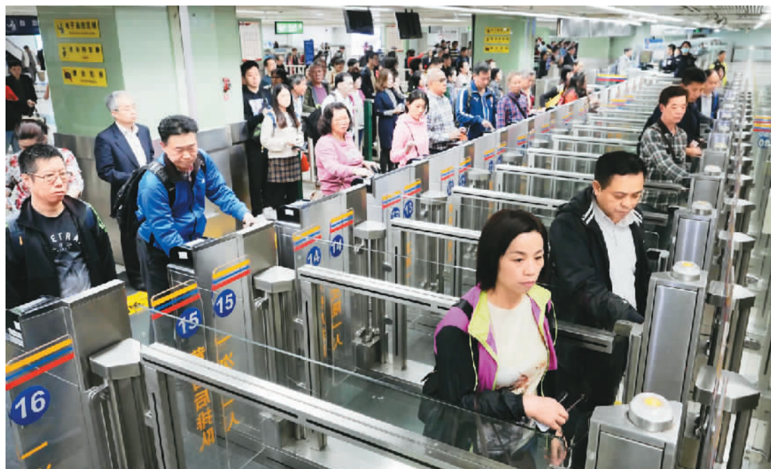
在深圳罗湖口岸联检大楼，旅客使用自助通关系统办理通关手续。