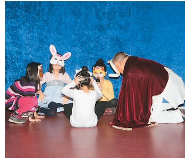
丹麦华人总会文化会和丹麦华人总会中文学校联合举办的“庆圣诞 迎新年 献才艺”活动现场。

值得一提的是，参加表演的丹麦华人总会少儿艺术团在平时常走访老人院，参加丹麦各地的文化节，为传播中国文化贡献良多。