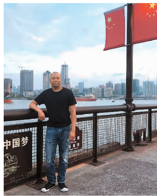
本文作者在上海留影

梦想没有大小之分，也没有贫富之分，它的意义在于鞭策我们不断进步，将梦中所想变为现实之事。我的梦想与中国、与上海、与复旦大学密不可分。