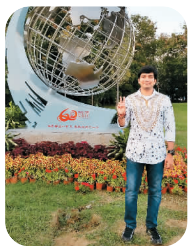
本文作者在合肥留影

作为一个外国人，我清楚地看到了中国城市的进步：便捷的公共交通、丰富的食品供应、数字化的城市安全监管、先进的淡水资源利用等令人印象深刻。中国的基础设施建设是超乎想象的，尤其是高速公路和铁路等公共交通设施。