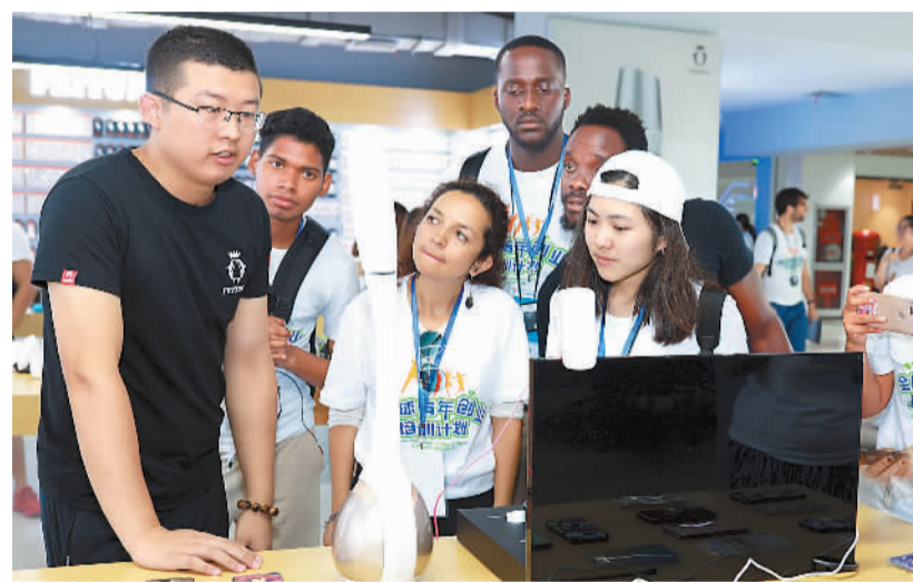
图为来自印度、南非、俄罗斯等金砖国家的年轻创业者，日前在浙江义乌国际商贸城学习创业知识并与义乌市场的青年创业者交流创业体会。

“气候变化对人类社会的风险是深远的，这是一个真正的问题。我认为中国正朝着正确的方向，做正确的事。”美国前能源部长朱棣文在接受媒体采访时如是说。