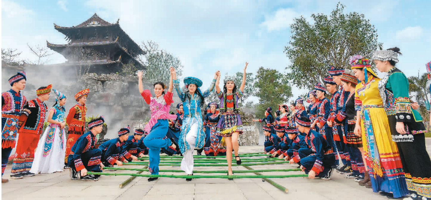
12月6日,第十二届中国(南宁)国际园林博览会在广西南宁园博园开幕。本届园博会以“生态宜居 园林圆梦”为主题,国内44个城市、东盟及“一带一路”沿线国家19个城市参展。这是第一次在少数民族地区举办的园博会。图为演员在表演竹竿舞。