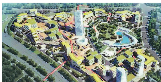
图为海归小镇起步区设计创意效果图。