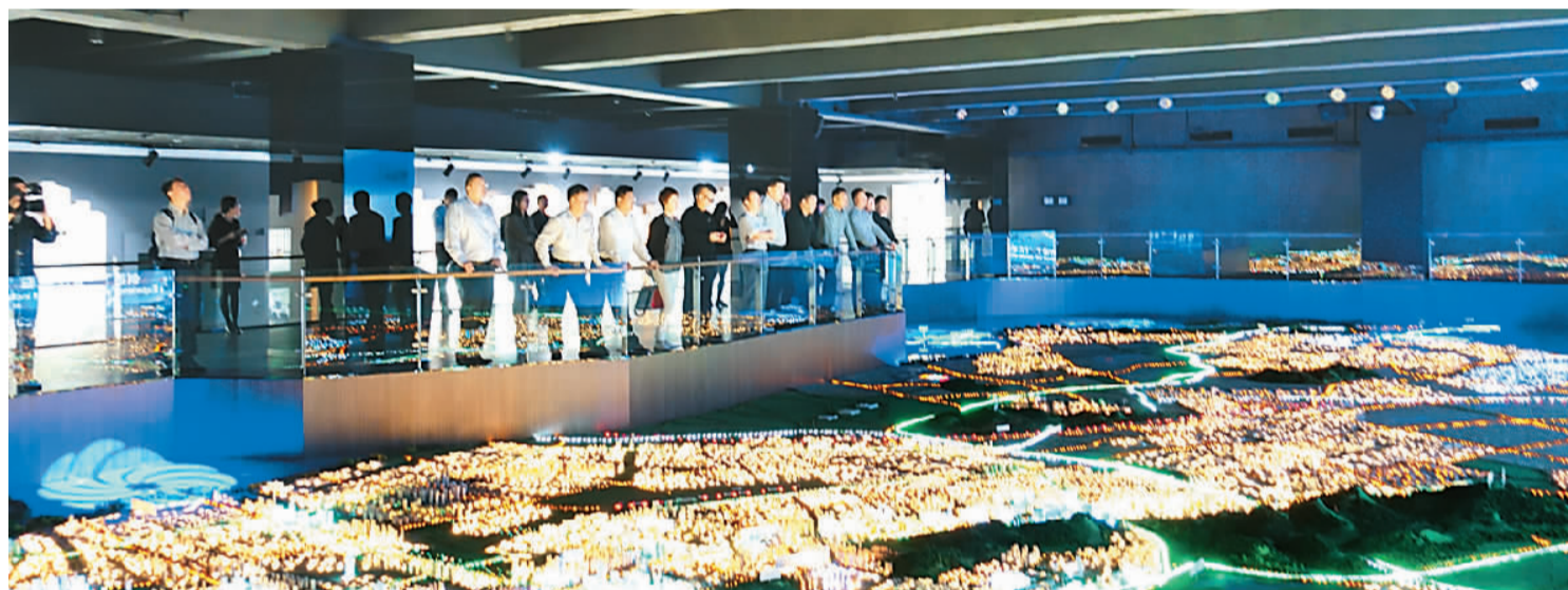
本报记者 孙亚慧 文/图