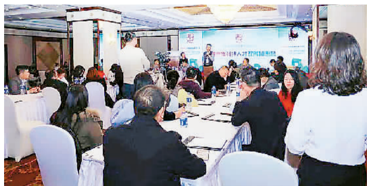
上图：“双创加速营”以服务海归青年创新驱动发展为主线，构建成果展示推介、技术对接、创新创业咨询的服务链。