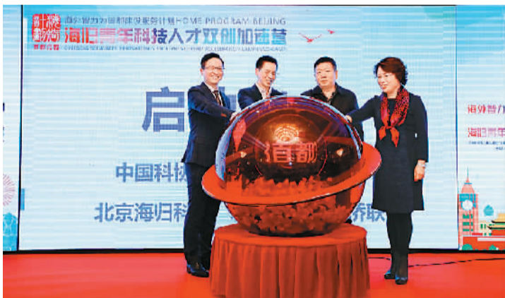
上图：“首都海归青年双创加速营”计划每年至少组织一期。

2018年是“海外智力为国服务行动计划”实施15年。海智计划，是为贯彻实施科教兴国、人才强国战略，吸引和组织海外科技工作者以多种方式为国服务，实现报国志向的国策型科技人才计划。自2004年启动至今，海智计划在引进海外技术项目、推荐适用人才、为地方政府提供咨询服务、培养人才、提高国内学术期刊水平等方面做了大量工作。