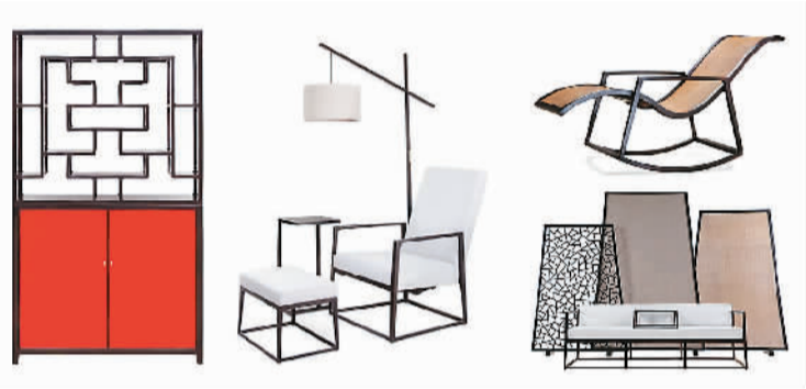
现代工艺植根传统家具（“平仄”家居品牌）