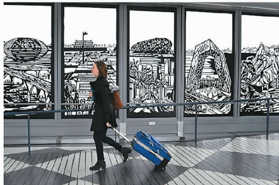
中国现代工艺剪纸应用于芝加哥奥黑尔国际机场空间装饰（乔晓光创作）