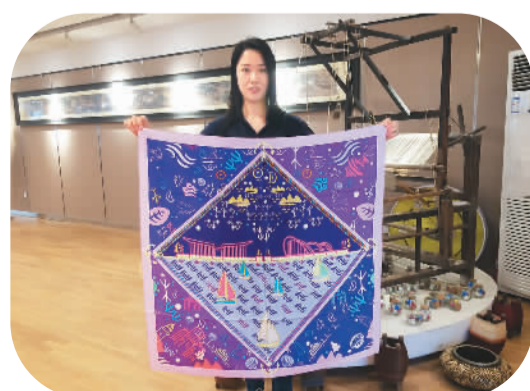
海润员工展示公司为上合组织青岛峰会设计的真丝围巾。（资料图片）

在陆上，海润丝绸产品从青岛胶州多式联运中心出发，通过中欧班列，到达俄罗斯后转乘中欧班列，运到德国，然后通过汽运，交付到客户手中；经海上，每年，海润陆续将丝绸产品装入近300个集装箱，从青岛港出发，发往全球各地。最终，这些高质量丝绸产品出口到俄罗斯、日本、巴基斯坦、土耳其、柬埔寨等30余个“一带一路”沿线国家和地区，每年出口额约7000万