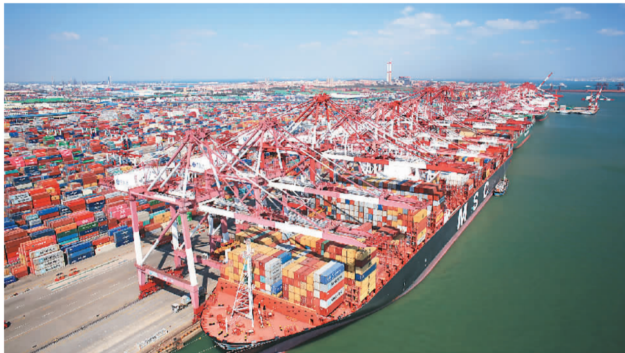
青岛港构筑起了联通“海上丝绸之路”沿线国家和地区的庞大海上贸易航线网络，集装箱航线总数近180条，位居中国北方港口首位。通过条条航线，青岛港跨越万里亚欧大陆与世界“链接”。

目前，青岛已在新加坡、韩国、德国、美国、日本、以色列、中国香港、英国、俄罗斯设立9处境外工商中心，拓展双向合作。今年以来，青岛还先后在“一带一路”沿线国家举办了40余场“通商青岛新丝路经济合作新伙伴”为主题的经贸促进活动，搭建起境内外交企间对话交流和双向投资合作平台。青岛遍布全球的96个国际经济合作伙伴中，绝大多数位于“一带一路”沿线国家和地区。