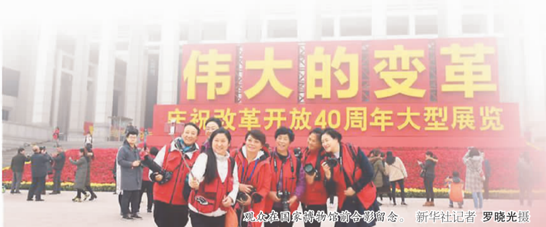
观众在国家博物馆前合影留念。

截至11月27日，这个展览的现场参观人数已超过56万人次。在如此热情的观众中，有一个特殊的群体，他们的故事就呈现在国家博物馆的展板上。像供产一样，他们是看展