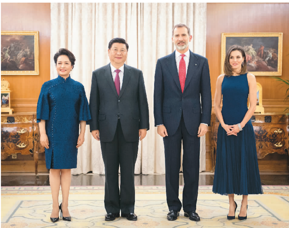
图为习近平和夫人彭丽媛同费利佩六世和王后莱蒂西亚合影。