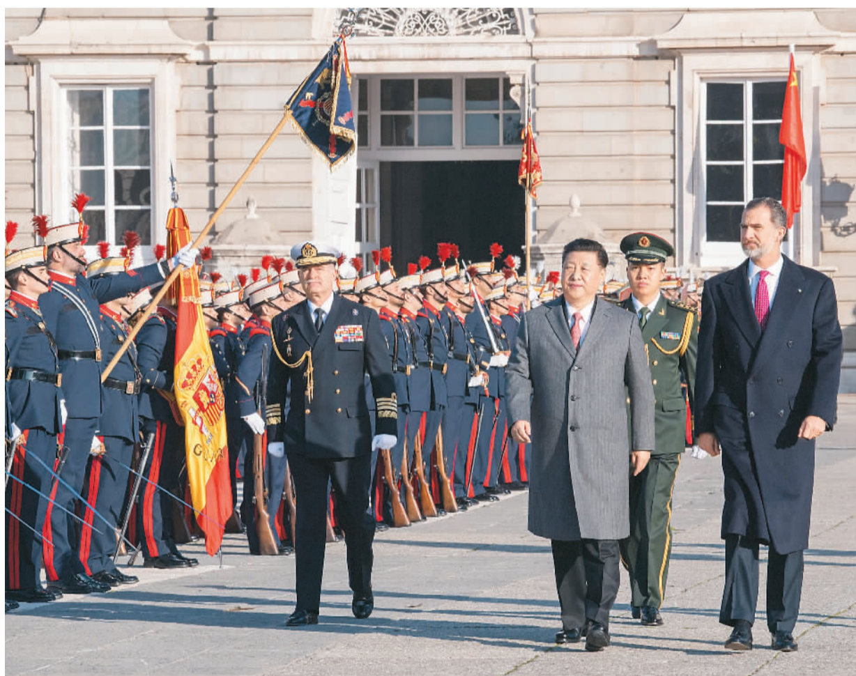
图为习近平在费利佩六世国王陪同下检阅步兵方队。

费利佩六世表示,热烈欢迎习近平主席对西班牙进行国事访问。今年是西中建交45周年,也是西班牙前国王胡安·卡洛斯一世首次访华40周年。西班牙珍视同中国的友好交往和合作。两国建交以来,一贯在涉及彼此核心利益的问题上相互尊重和支持。在双方共同努力下,两国全面战略伙伴关系不断得到新发展。西方愿同中方继续保持密切交往,提升务实合作水平,加强在多边事