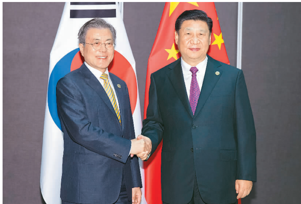
图为十一月十七日,国家主席习近平在莫尔兹比港会见韩国总统文在寅。