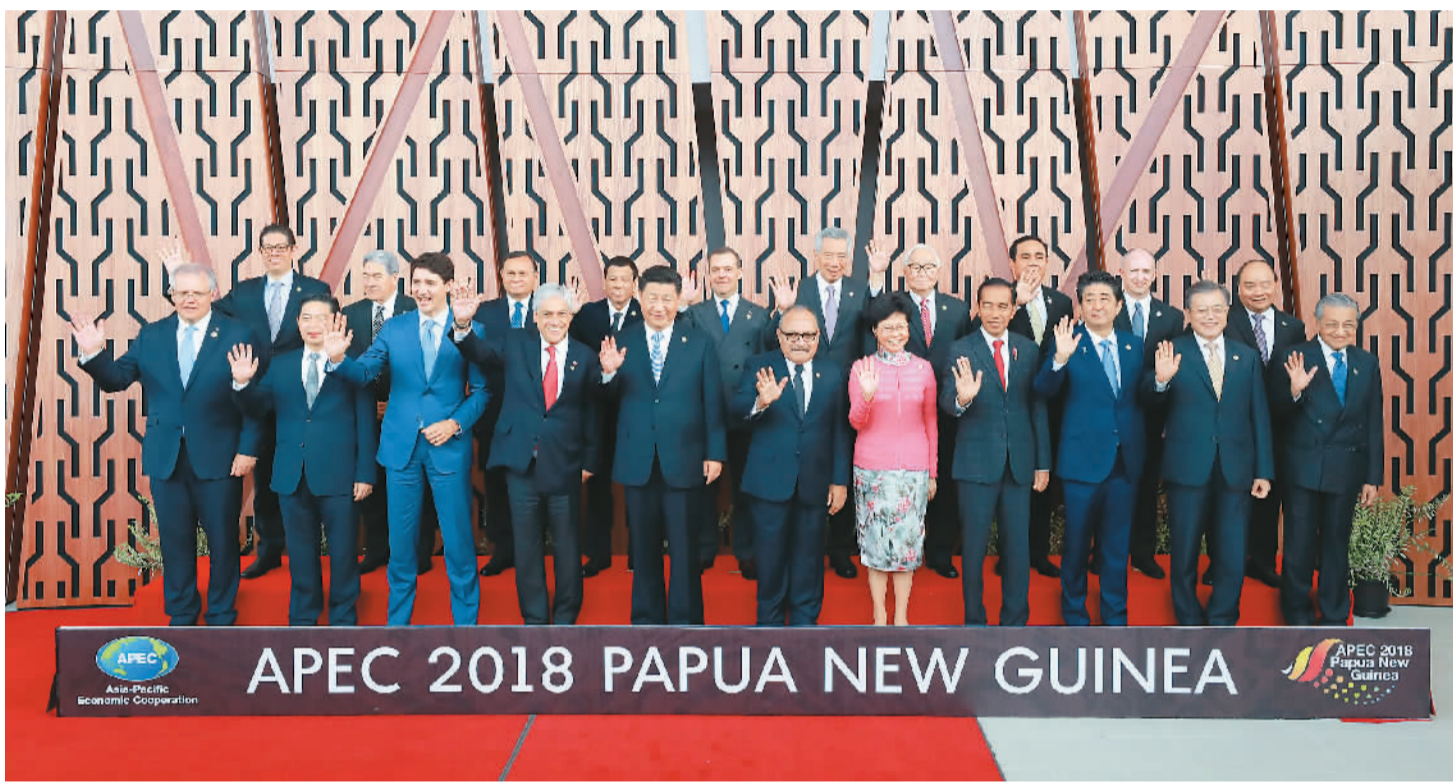
11月17日, 习近平出席亚太经合组织领导人同工商咨询理事会代表对话会。图为对话会前, 习近平同其他亚太经合组织成员经济体领导人、代表合影。

国家主席习近平17日应邀出席在巴布亚新几内亚莫尔兹比港举行的亚太经合组织工商领导人峰会并发表题为《同舟共济创造美好未来》的主旨演讲, 强调要为世界经济发展把握正确方向, 为国际社会找到有效治理思路, 同舟共济, 共同驾驶世界经济的大船驶向更加美好的彼岸。中国在实现自身发展的同时, 将为世界各国共同繁荣作出更大贡献。共建“一带一路”是中国同世界共享机遇、共谋发展的阳光大道。 (详细报道见第二版、演讲全文见第三版)