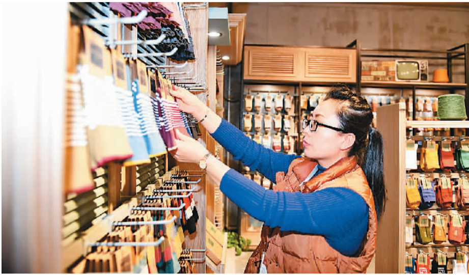
吉林省辽源市坚持放手发展民营经济，走出了特色鲜明的发展之路。图为在辽源市东北林业纺织工业园的一家袜企内，工作人员整理展示样品。

海外网文章《望海楼：走向更加广阔舞台》评论道，把公有制经济巩固好、发展好，同鼓励、支持、引导非公有制经济发展不是对立的，而是有机统一的。中国这么大、人口这么多，要把经济社会发展搞上去，就要大家齐心协力来干，“众人拾柴火焰高”。《望海楼：迎来更加光明的发展前景》也评论，当前，我国经济运行总体平稳、稳中有进，主要指标保持在合理区间。只要我们保持战略定力，坚持稳中求进工作总基调，以供给侧结构性改革为主线，全面深化改革开放，我国经济就