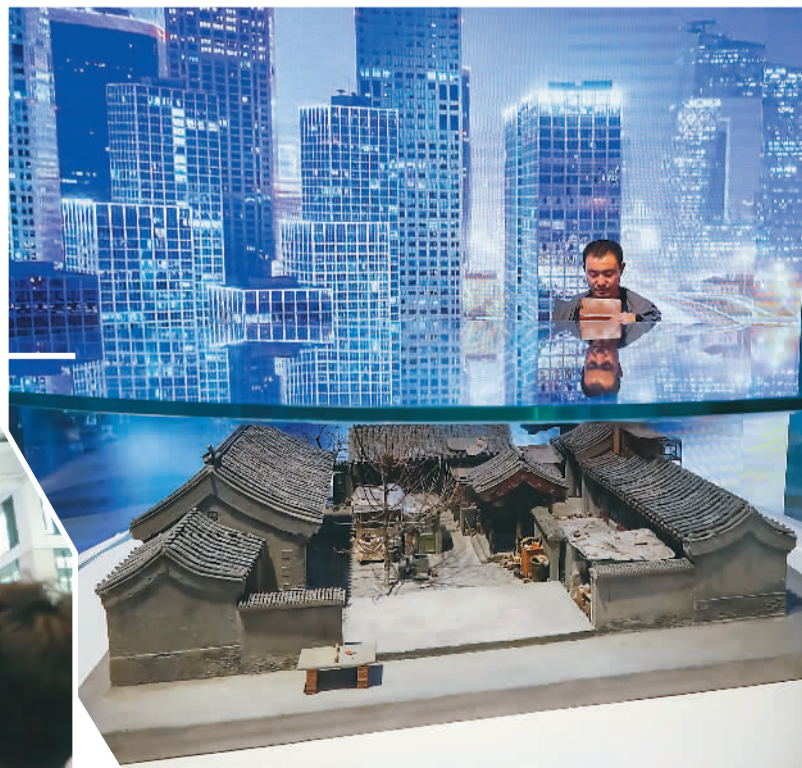
▲观众在观看微缩模型“记忆”。 ▲观众在参观“伟大的变革——庆祝改革开放40周年大型展览”。