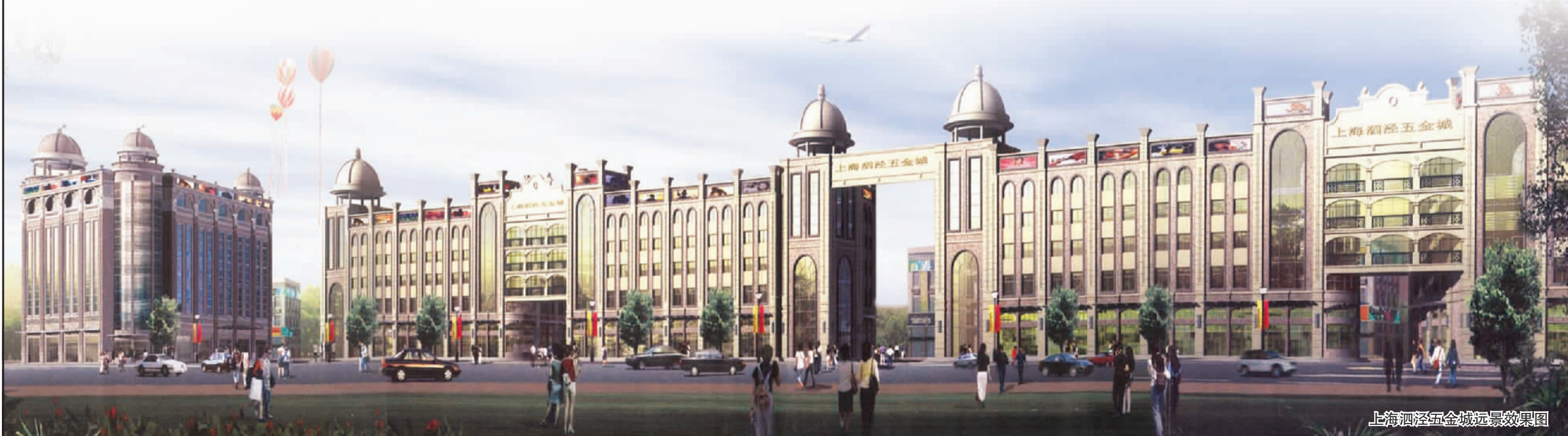
上海泗泾五金城远景效果图

地址：上海市松江区泗泾镇沪松公路2511弄 电话：021-67769008-8002