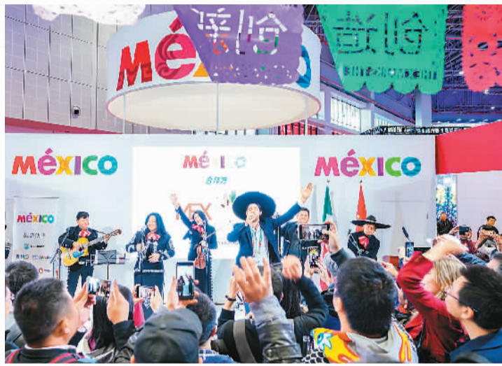
上图：11月9日，表演者在墨西哥展区表演歌曲。

欧姆龙集团董事长立石文雄在接受本报记者采访时介绍，在本次进博会上，欧姆龙带来了高速高精度、实现柔性生产的机器人一体化生产线，以此展示欧姆龙在科技发展新浪潮下，以前沿的机器人技术、人工智能技术和信息技术为制造业打造自动化生产新模式，助力中国制造业向智能化升级。在他看来，进博会是一个非常好的平台，是欧姆龙与中国制造业伙伴相识并加深了解的绝