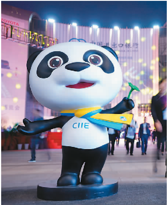
首届中国国际进口博览会吉祥物。

新华社评论《新时代中国与世界共享未来——论习近平主席在首届中国国际进口博览会开幕式主旨演讲》称，在进博会开幕式上，习近平主席提出激发进口潜力、持续放宽市场准入、营造国际一流营商环境、打造对外开放新高地、推动多边和双边合作深入发展等5个方面的务实举措，表明新时代中国改革不停顿、开放