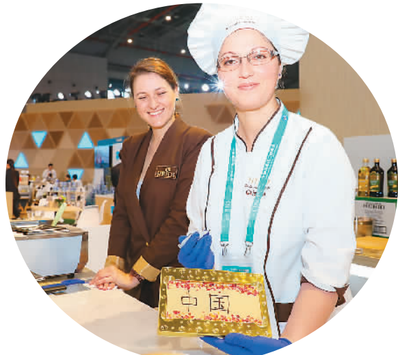
在进博会食品及农产品展区，瑞士甜点师为观众定制个性化巧克力。

一名微博网友评论：“领中国开放之先，为上海骄傲！”新时代，新气象，新发展，“身为‘90后’的我们，感受到了未来可期，更多的机遇将赋予我们”，网友“Zelei”对未来充满信心。