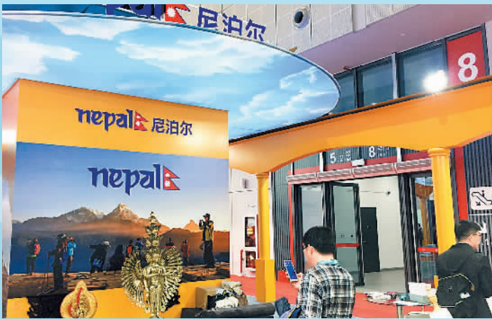
上图：尼泊尔展馆。 下图：加拿大展馆。