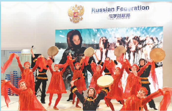
上图：俄罗斯艺术团在俄罗斯展馆内表演舞蹈。 下图：肯尼亚展馆。

他说，“很高兴进博会将成为一场定期举办的活动，无疑澳大利亚企业也会非常乐意回到这里。”