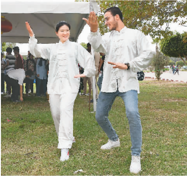
10月23日，埃及苏伊士运河大学内张灯结彩、人头攒动，孔子学院2018年中国文化周正式开幕。 图为在埃及伊新梅利亚，孔子学院老师（左）在中国文化周上教学生武术。