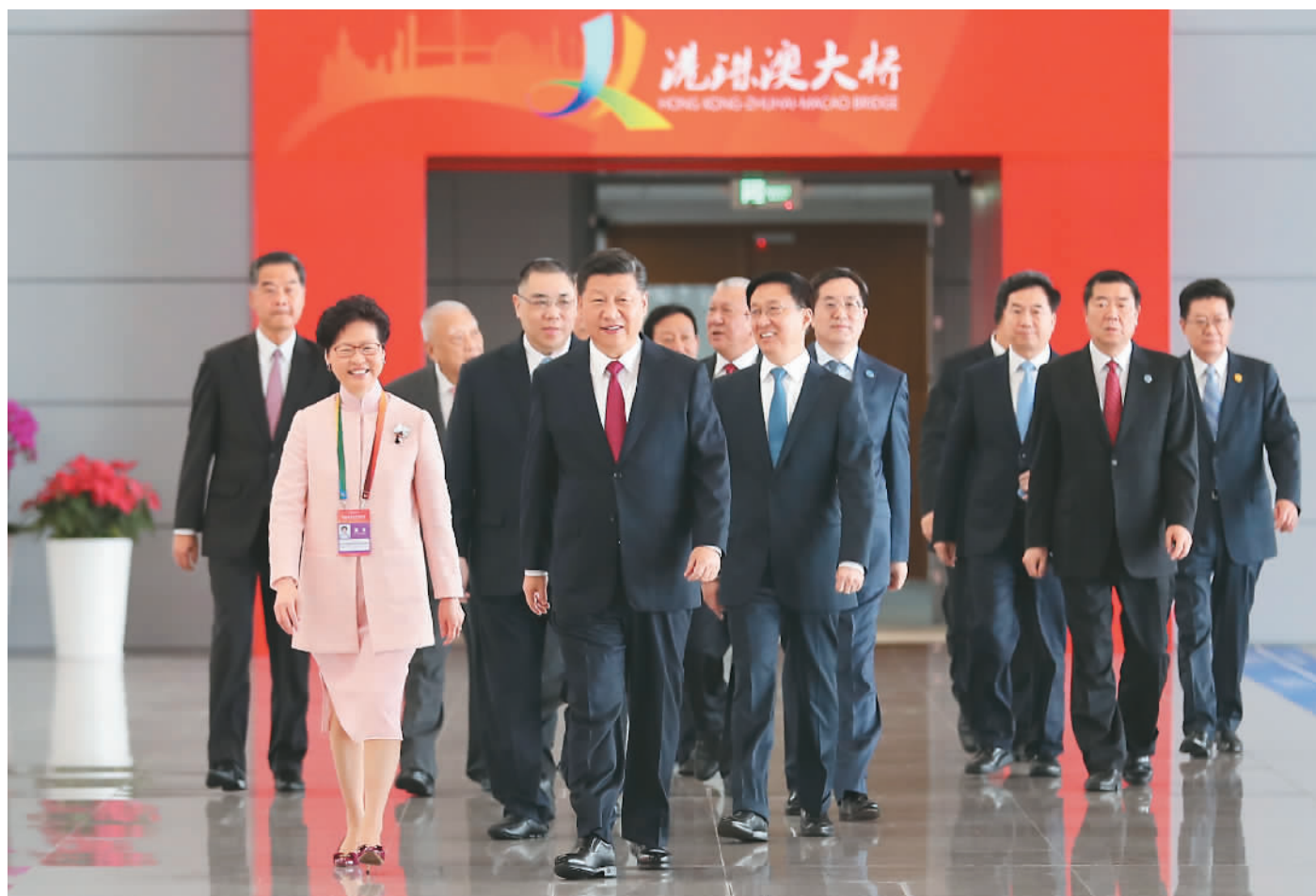
10月23日上午,港珠澳大桥开通仪式在广东省珠海市举行。中共中央总书记、国家主席、中央军委主席习近平出席仪式,宣布大桥正式开通并巡览大桥。图为习近平等步入仪式现场。新华社记者 谢环驰摄

港珠澳大桥的建设创下多项世界之最,非常了不起,体现了一个国家逢山开路、遇水架桥的奋斗精神,体现了我国综合国力、自主创新能力,体现了勇创世界一流的民族志气。这是一座圆梦桥、同心桥、自信桥、复兴桥。大桥建成通车,进一步坚定了我们对中国特色的社会主义的道路自信、理论自信、制度自信、文化自信,充分说明社会主义是干出来的,新时代也是干出来的!