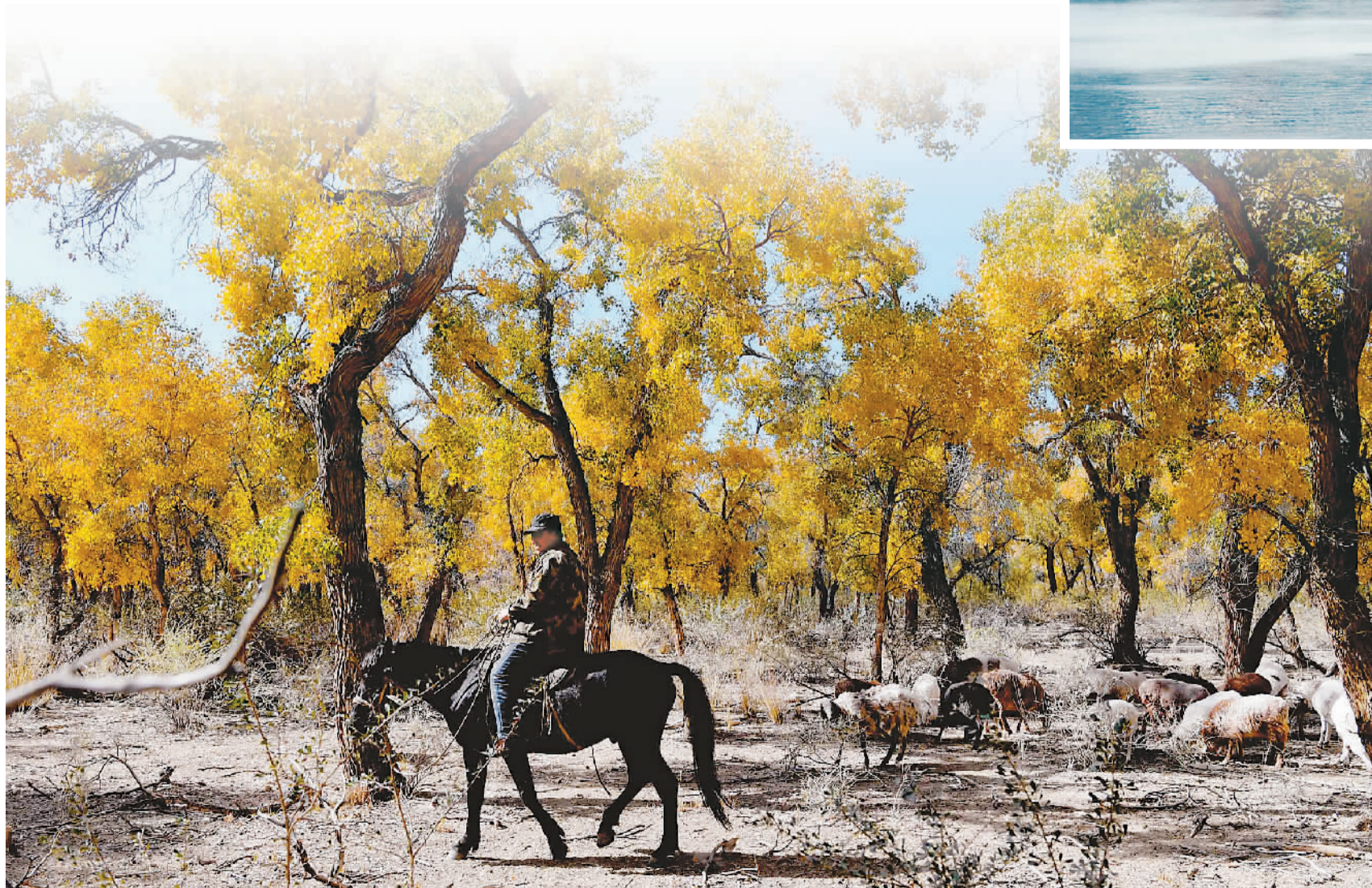
9月29日，新疆克拉玛依市乌尔禾区，牧羊人赶着羊群行进在30万亩胡杨林中。