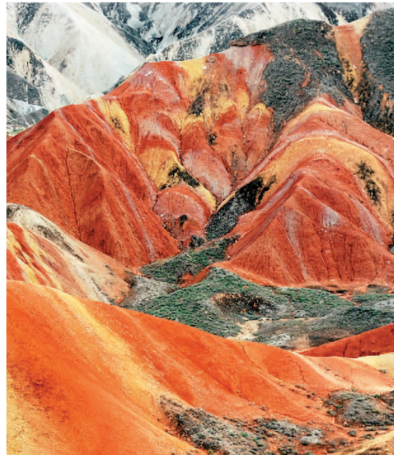
秋季，地处祁连山北麓的甘肃张掖丹霞国家地质公园内的丹霞地貌色彩艳丽，层理交错，美如画卷。