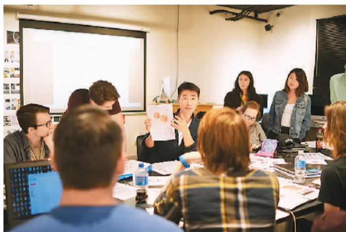
迅迅与学生讨论设计