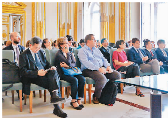
图为“改革开放40年：全球政治经济中的中国”论坛现场。