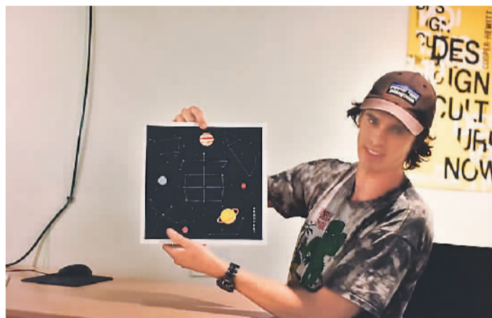
“繁星浩宇”灯与设计者瑞利