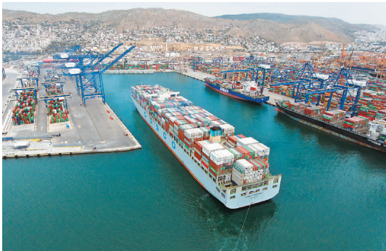
中远海运的货船驶出希腊比雷埃夫斯港集装箱码头。