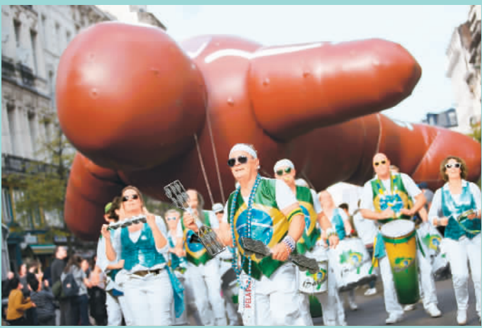
9月15日，在比利时首都布鲁塞尔，乐队参加卡通气球大巡游。

布鲁塞尔漫画节的重头戏——卡通气球大巡游15日在布鲁塞尔举行，众多家喻户晓的巨型卡通气球亮相，为市民和游客带来了欢乐。