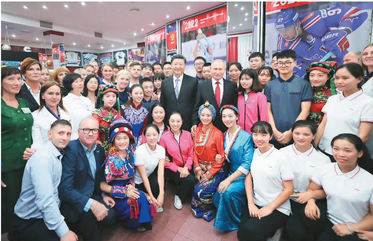
9月12日,国家主席习近平在符拉迪沃斯托克同俄罗斯总统普京一起访问“海洋”全俄儿童中心。图为习近平和普京同中俄青少年代表及中心教职工代表合影。

习近平指出,中俄是山水相连、同舟共济的好邻居、好伙伴,两国人民守望相助、患难与共,谱写了许多感人故事。2008年中国汶川特大地震发生后,俄方救援队第一时间赶赴灾区救援。应俄罗斯政府邀请,996名灾区中小学生来到“海洋”全俄儿童中心疗养,收获了终生难忘的“海洋”记忆。中俄关系发展史,也是两国青少年密切交往的历史。近年来,中俄青少年交流日益密切,增进了相互了解和友谊。 (下转第四版)