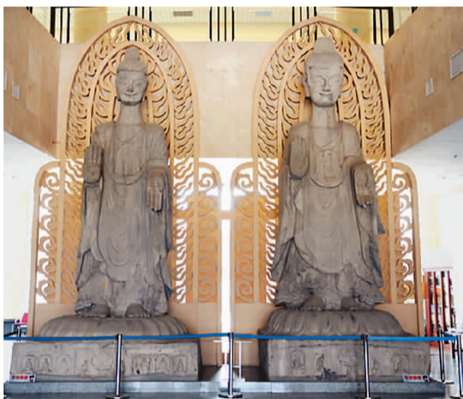
北魏双丈八佛石造像