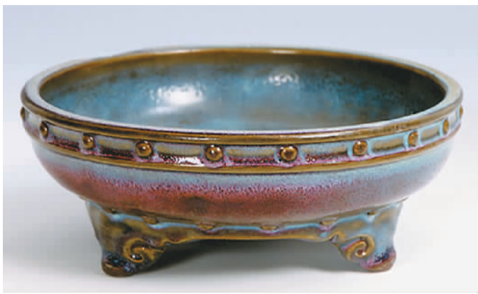
宋代钧窑乳钉鼓式洗

其它有代表性的文物，还有清末朱奎本设色芦雁荷花图轴、商黄玉璇玑、东周齐建邦张法刀、明拓秦泰山碑拓等。