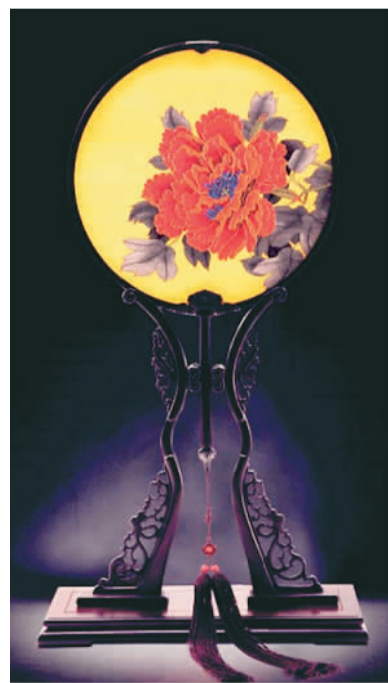
盛春作品《花好月圆》

团扇的扇形变化多端，在历代发展中演化出了铜镜式、宫灯式、金钟式、钟离式、鸡心式、凤尾式、龙球式、海棠式、玉佩式、黑花式、六角式等丰富的样态。盛春创作的《凤栖牡丹》是桐叶式扇形，辅以缙丝扇面，扇顶部为铜镀金护顶，下部为花形护托，以紫檀木制扇柄，嵌寿字银丝。凤栖梧桐之上，头向牡丹，花开富贵，佐以香包点缀，一扇轻摇而香风翩至。《花戏蝶》为芭蕉式，上广下狭，上端翘起，使扇面呈立体弧度。扇框以宋锦包边，彰显华丽姿态。扇面蓝地上缙织折枝牡丹花及蝴蝶图案，依画理铺排，花叶绚丽多姿，清秀中不失奢华气度。《花好月圆》为紫花檀木圆形扇框，扇框上下衬以福纹尾花，配以牡丹缙丝扇面，明艳华美，传递出美好的祝福。