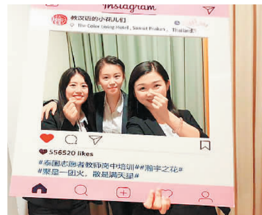
泰国汉语教师志愿者在培训期间合影。