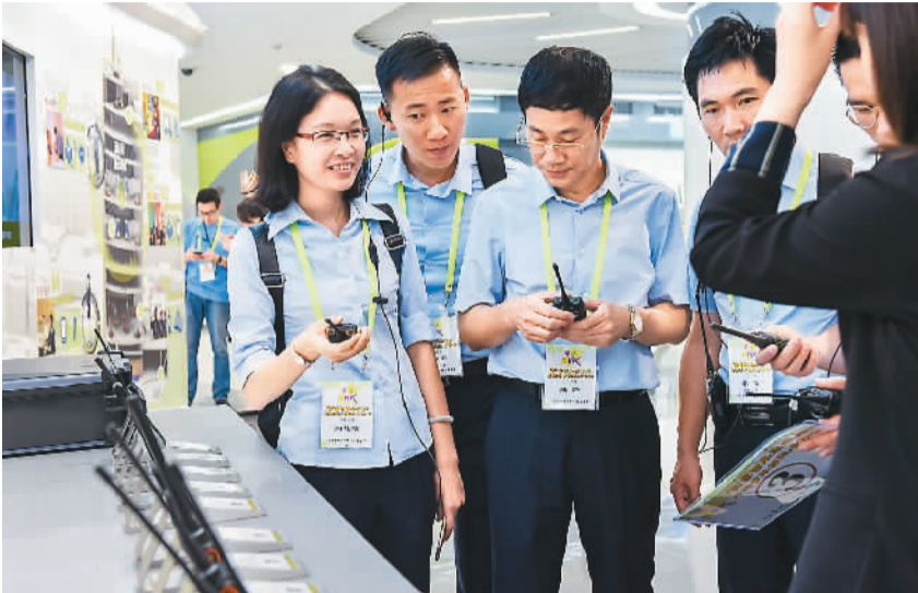
图为香港青年代表在深圳海能达通信股份有限公司总部展厅参观。

“在这里开公司，租金还不到市场价的1/2。”刚从学校毕业的魏先生有志于从事电脑游戏产业，如今创业方案成竹在胸，办公场所的问题也要解决了。 他所看中的地方是位于香港岛黄竹坑的创协坊。这是慈善团体保良局响应特区政府“青年共享空间计划”推出的一个创业支援项目。该项目按“民、商、官”三方合作模式运作，为青年企业家及从事创意工作的青年提供共享工作空间，租金很是优惠。 “香港房价太贵了，很多同学创业的想法都因此告吹。”魏先生说，特区政府新推出的计划可谓是一场“及时雨”。 “青年共享空间计划”得到了不少香港爱心企业家的支持，他们提供的10个物业分布于观塘、荃湾、黄竹坑、荔枝角、湾仔等地，总楼面近9万平方英尺，较预计的6万平方英尺多出不少。如今，首期计划尚在顺利推进，特区政府已宣布第二期计划也列入了日程。 助力青年创业，更要为青年人成长“充电”。特区行政长官林郑月娥多次强调，特区政府致力于促进青年人建立积极的人生观，对社会有担当，具备国家观念、香港情怀和国际视野。 为帮助青年人开阔视野、增长才干，青年发展委员会和民政事务局举办或资助不同类型的青年发展活动，提升他们的竞争力，让青年人各展所长。据了解，目前每年平均有超过7万名香港青年参加政府举办、资助或协调的内地和海外交流实习计划。 记者注意到，在数百个青年内地交流项目中，合资格参加者在内地的