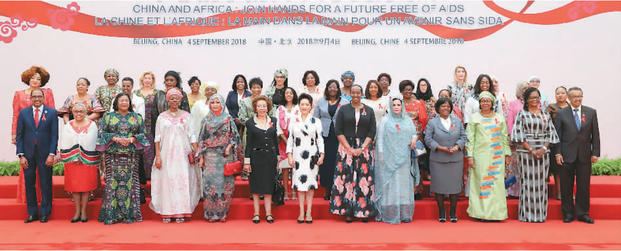
9月4日，国家主席习近平夫人彭丽媛在北京钓鱼台国宾馆芳华苑出席“中非携手抗艾 共享美好未来”专题会议并发表致辞，与非洲国家元首、政府首脑夫人共同发布《中非艾滋病防控专题会议联合倡议》。