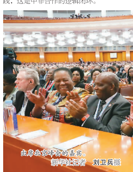
出席北京峰会的嘉宾。