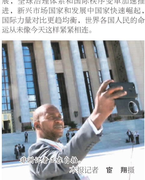
非洲记者正在自拍。