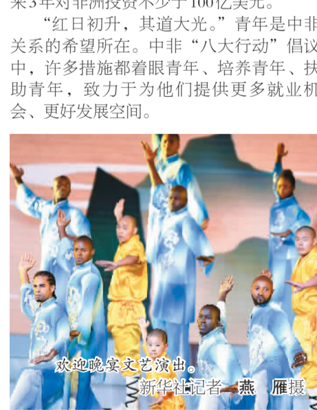
欢迎晚宴文艺演出。

中非合作论坛北京峰会开幕。开幕式上,习近平总书记发表了重要讲话,其中有这么一段话引发了热烈的掌声——