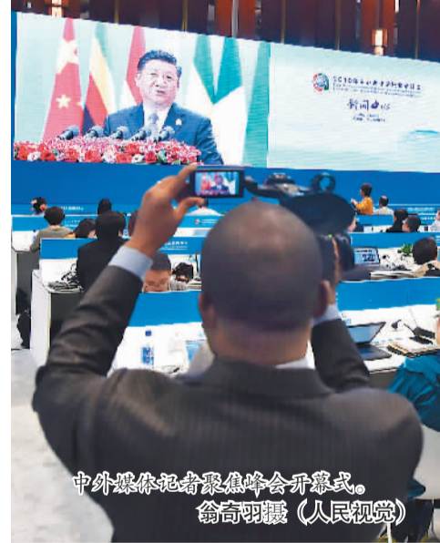
中外媒体记者聚焦峰会开幕式。