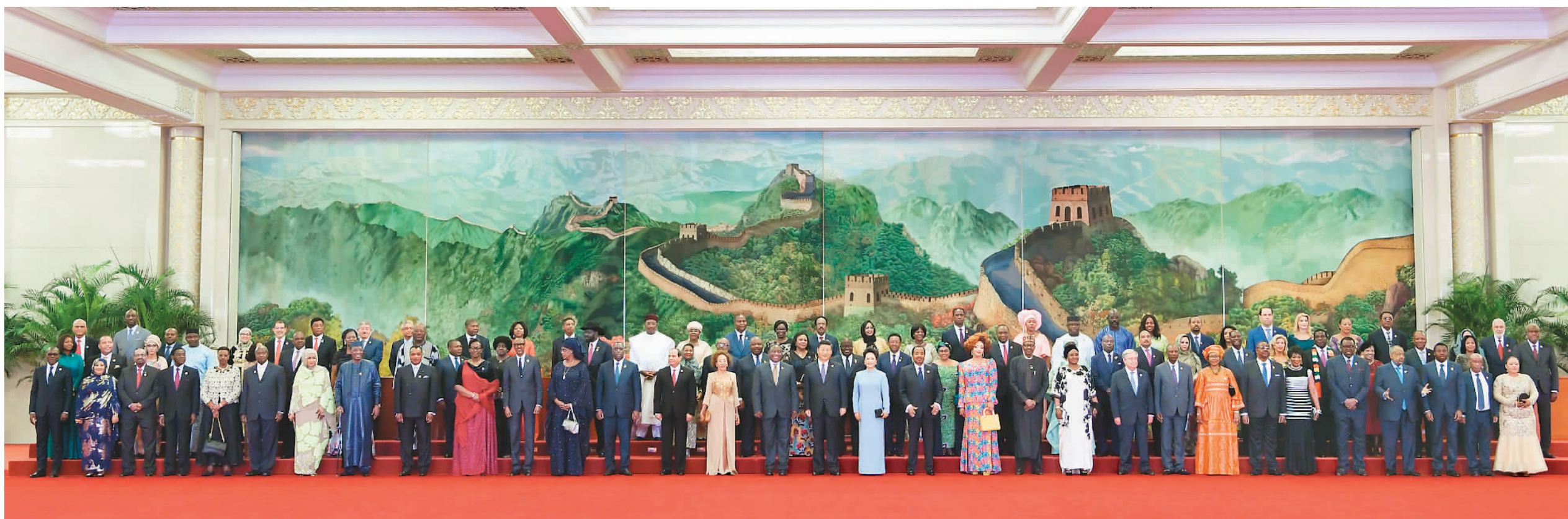
9月3日，国家主席习近平和夫人彭丽媛在北京人民大会堂举行宴会，欢迎出席中非合作论坛北京峰会的外方领导人和夫人。图为晚宴前，习近平和彭丽媛同外方领导人和夫人在巨幅苏绣壁画《长城》前合影留念。