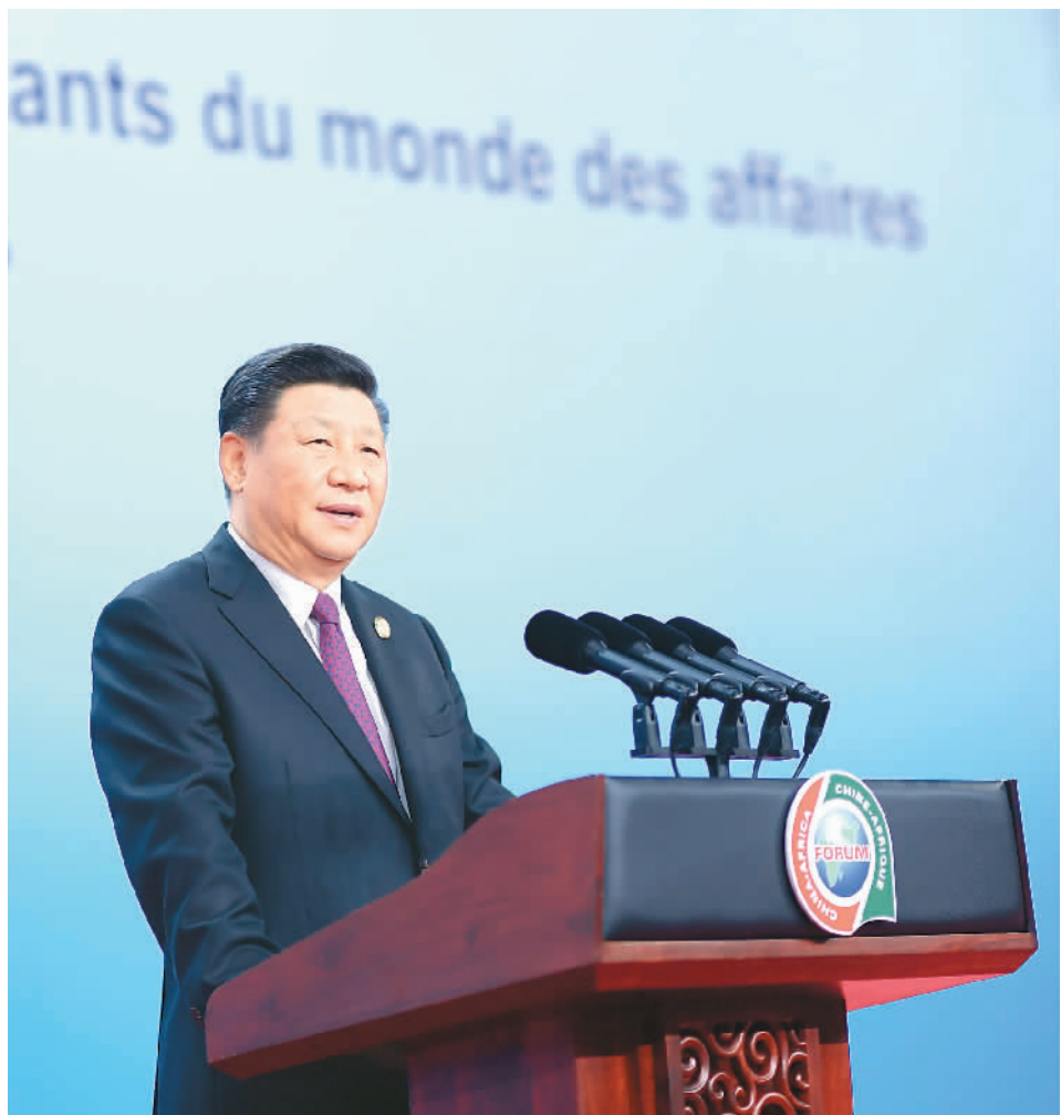
9月3日，国家主席习近平在北京国家会议中心出席中非领导人与工商界代表高层对话会暨第六届中非企业家大会开幕式并发表题为《共同迈向富裕之路》的主旨演讲。

本报北京9月3日电（记者裴广江、王云松）国家主席习近平3日在国家会议中心出席中非领导人与工商界代表高层对话会暨第六届中非企业家大会开幕式并发表题为《共同迈向富裕之路》的主旨演讲，强调中国支持非洲国家参与共建“一带一路”，愿同非洲加强全方位对接，打造符合国情、包容普惠、互利共赢的高质量发展之路，共同走上让人民生活更加美好的幸福之路。