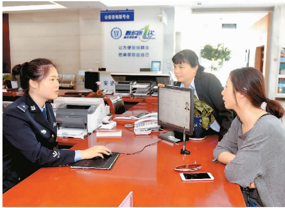
浙江省义乌市公安机关依托浙江政务服务网，构建了一个集咨询、查询、预约、办理等功能于一体的“互联网+政务服务”新模式，实现一网受理、一次办成。