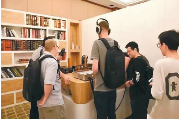
倾听黑胶唱片的优美原声

文化收藏的近百张珍贵稀有的原版黑胶唱片，通过黑胶唱片留声机听到优美的经典音乐。华韵文化多年来收藏了从1896年清末黄龙唱片到共和国成立后的数万张黑胶唱片，还运用国外先进的机器设备、通过高科技技术手段，对这些老唱片进行抢救修复及数字化保存，真实还原音乐经典，使之永久流传。华韵文化的有声文化遗产数字典藏技术团队，承接了故宫博物院、国家图书馆、中央音乐学院等众多国家重点文化单位的有声文化遗产数字化修复项目。华韵还对现有音乐资源进行整合，打造了涵盖戏曲、曲艺、歌曲、歌舞、器乐等多种类型中国传统音乐数字资源平台——中国音网。（李婧璇）