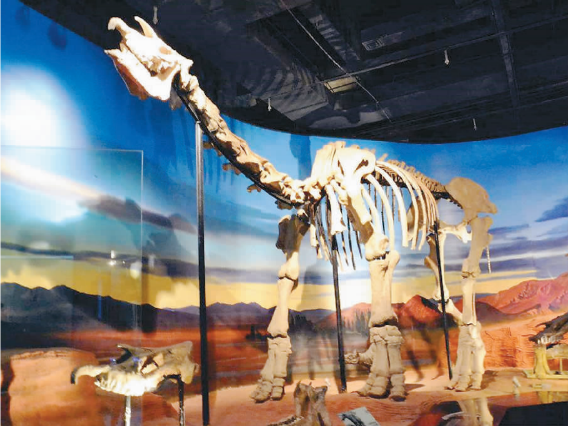
距今约2400万年的美丽巨犀化石

箜篌是一种古代的弹拨乐器，吐鲁番先民在举行重大礼仪，特别是原始宗教活动时使用，后来逐渐失传。古代文学作品中不乏有关箜篌的描写，一些壁画和浮雕中也能窥见其大致模样，但实物传世甚少，今人难以知晓它的具体构造。洋海墓地出土的这件箜篌，是我国现存较早的箜篌，且保存较为完整，堪称乐器史上非常重要的发现。它为研究古代竖琴构造和音律提供了难得的资料，填补了史前时期新疆乐器史的空白。