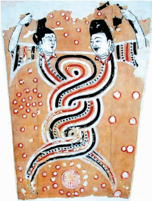
公元5世纪的伏羲女娲像绢画