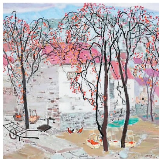
屋后的柿子树 毛岱

作为本次展览的年度关注艺术家，赵培智的作品描绘新疆地区朴素的日常生活，整体概括的手法传达出当地人淳朴的精神面貌；张新权的作品则带着浓郁的时代风貌，不管是画里的渔船还是城市景观，似乎是数字时代的隐喻……艺术家们以多元的文化视角体悟人文自然，在写意精神的引领下，挣脱油画表现技法流派的束缚，抒胸中意气，写神州风华。